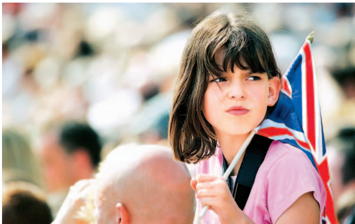
Navzdory teroru. Tisíce Londýňanů včera vyrazily do ulic. Obyvatelé města věnovali vzpomínku svým válečným veteránům a uctili oběti druhé světové války (Británie si konec války na rozdíl od Evropy tradičně připomíná až 10. července).

Pachatelé atentátů pravděpodobně žili v Británii od narození • Nebyli na seznamech extremistů