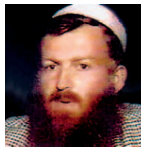
Britská média přetiskují jména a tváře extremistů, kteří mohli být zapleteni do útoků. Jedním z nich je i původem Syrán Mustafá Sítmarján Nasar .

kterého mohla skupina extremistů čítat jen hrstku lidí, kterým se dostalo jen základní pomoci a koordinace ze zahraničí.